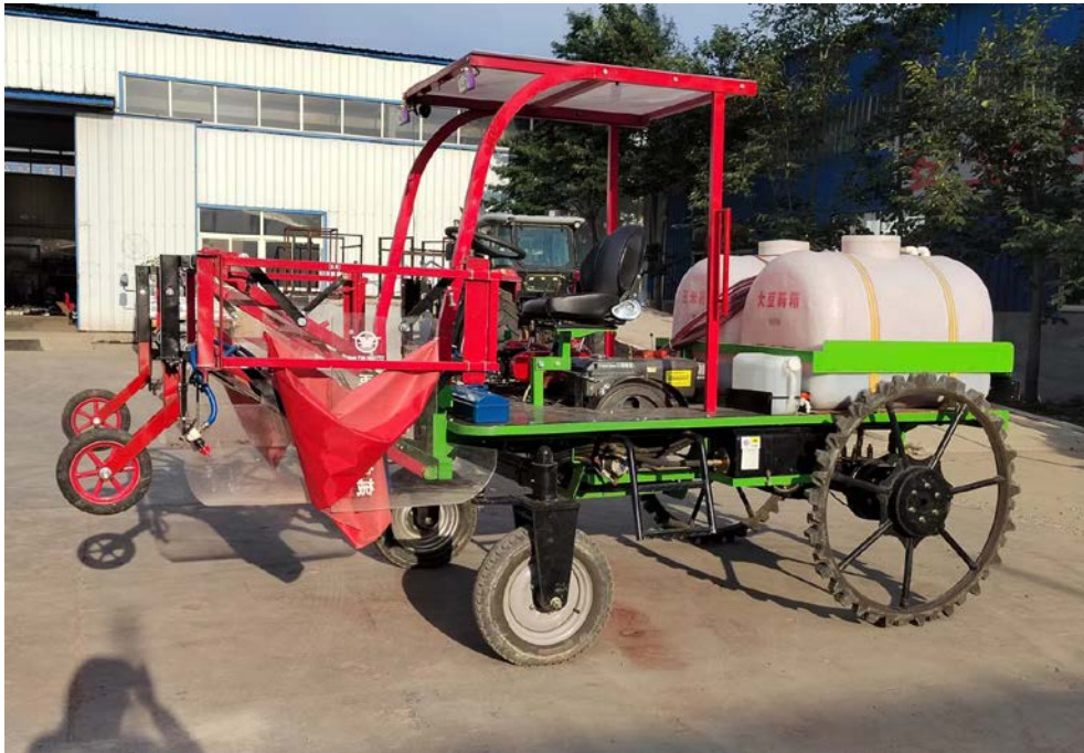
XXX 型 XXX 产品

XXX 型 XXX 产品(样机生产日期/编号：XXX/XXX)主要由行走底盘、发动机、两个药箱、两个液泵、两套分配器和两套喷雾系统、防飘喷头、喷杆架、隔离防护装置、机架和两轮/四轮转向系统等组成（双喷雾系统适用）。产品见下图：